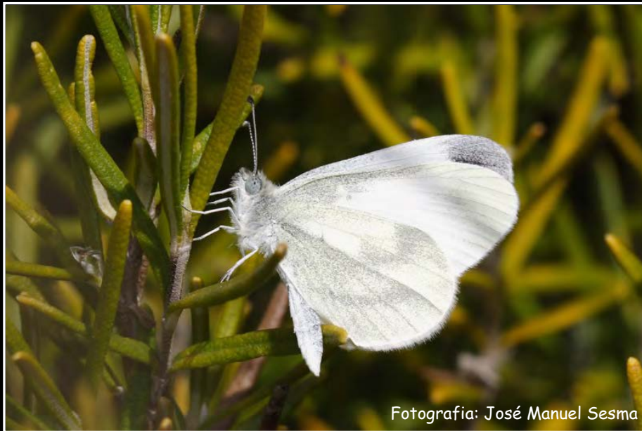
Fotografía: José Manuel Sesma